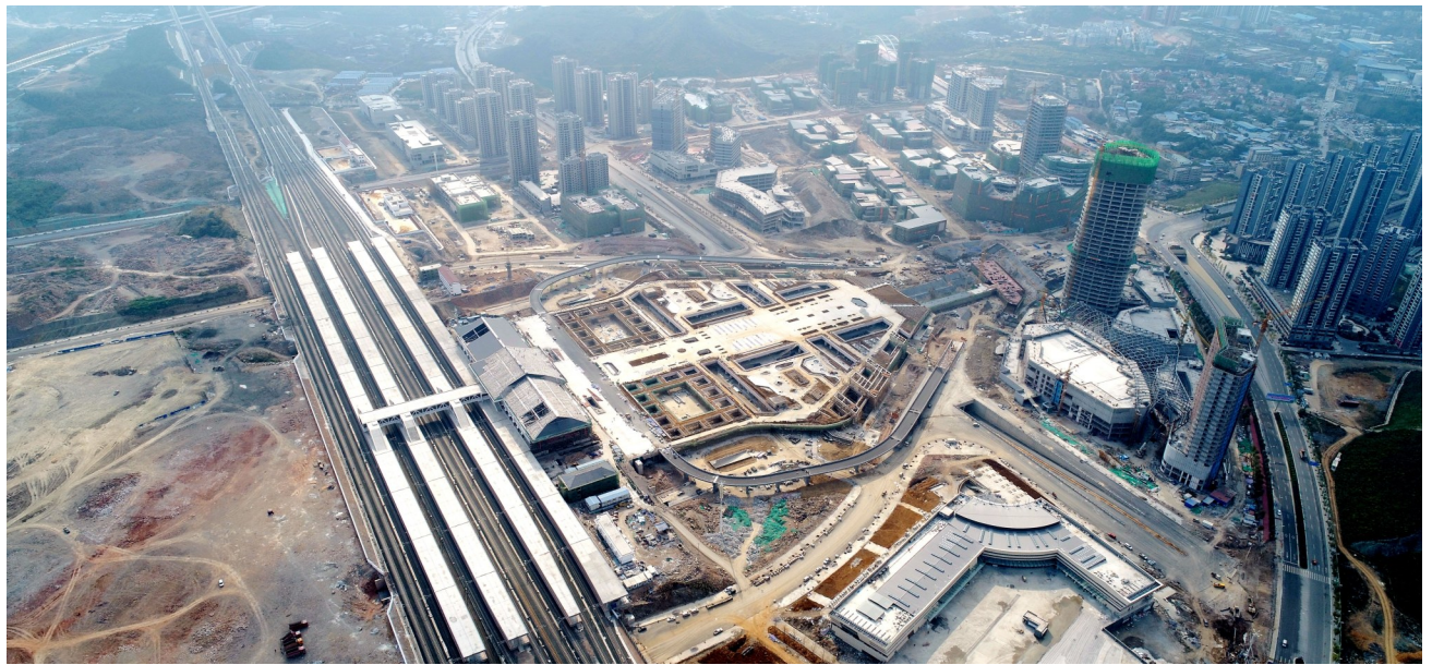
高铁新城鸟瞰全景

如今,再走进占地1080亩的高铁新城和9400亩的贵州黔北现代物流新城,一幢幢富有现代化气息的大楼拔地而起,从最初的荒芜之地到如今的初见雏形,遵义从内陆城市到快步迈向世界,一点一滴,凝聚着铁投人的丝丝心血。(下转第2版)