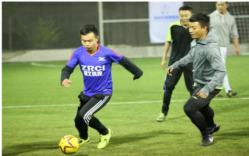
比赛进行得很激烈